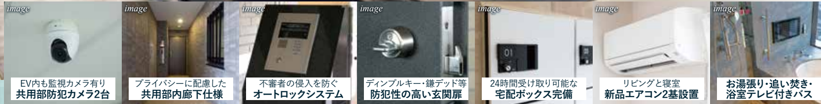
EV内も監視カメラ有り 共用部防犯カメラ2台