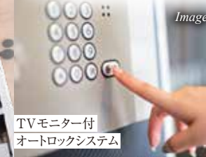
TVモニター付 オートロックシステム