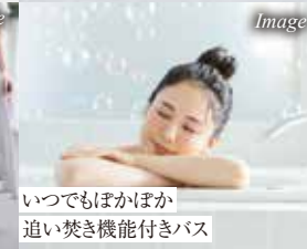
いつでもほかに 追いつき機能付きバス