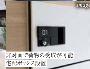
非対面で荷物の受取が可能 宅配ボックス設置