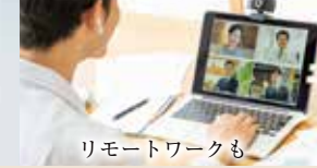
リモートワークも