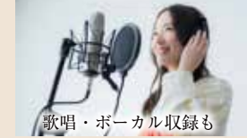
歌唱・ボーカル収録も