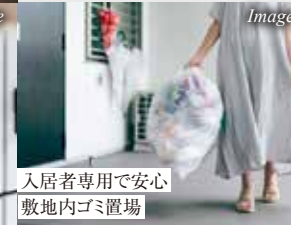
入居者専用で安心 敷地内ゴミ置場