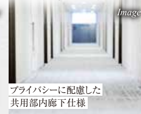
プライバシーに配慮した 共用部内廊下仕様