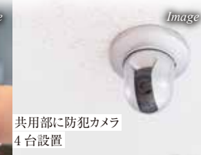
共用部に防犯カメラ 4台設置