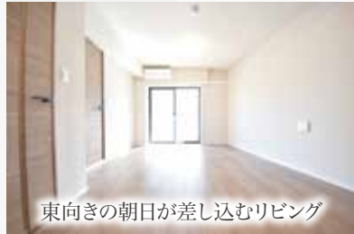
東向きの朝日が差し込むリビング