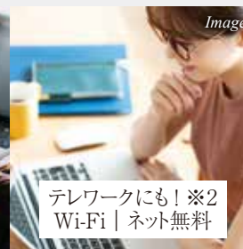
テレワークにも!※2 Wi-Fi | ネット無料