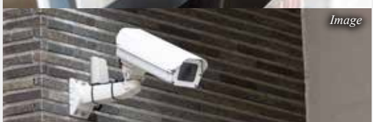
安全性に配慮し共用部に防犯カメラ設置