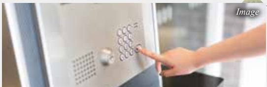
不審者の侵入を防ぐTVモニター付オートロック