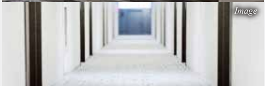
プライバシーが守られる共用部内廊下仕様