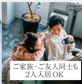
ご家族・ご友人同士も2人同居OK