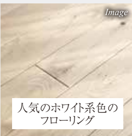
人気のホワイト系色のフローリング