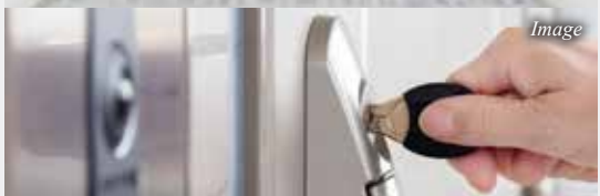
ディンプルキー・ドアガード等セキュリティ玄関扉