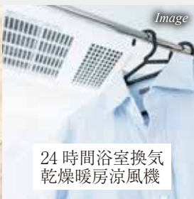
24時間浴室換気乾燥暖房涼風機