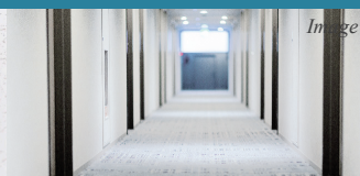
女性でも安心♪ 共用部内廊下仕様