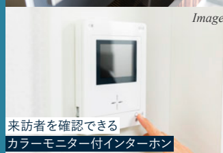
来訪者を確認できる カラーモニター付インターホン