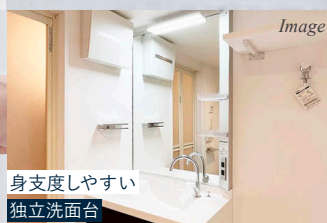
身支度しやすい 独立洗面台