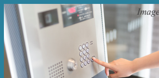
不審者の侵入を防ぐ TVモニター付オートロックシステム