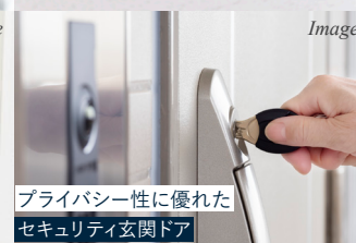
プライバシー性に優れた セキュリティ玄関ドア