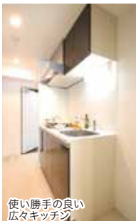
使い勝手の良い広々キッチン