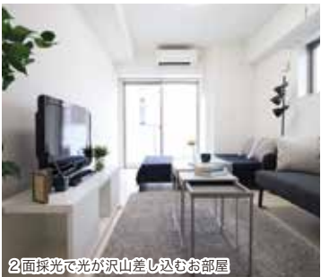
2面採光で光が沢山差し込むお部屋