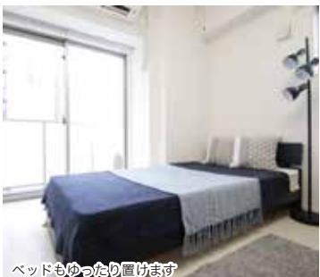
ベッドもゆったり置けます