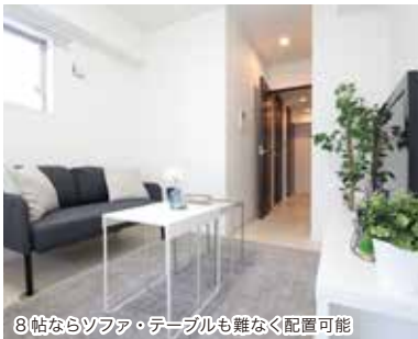
8帖ならソファ・テーブルも難なく配置可能