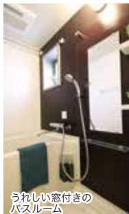
うれしい窓付きのバスルーム