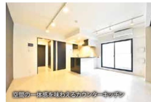
空間の一体感を味わえるカウンターキッチン

普通賃貸借2年契約(更新型) 敷金0ヶ月 礼金0ヶ月 保証人不要システム利用必須 24時間安心サポート料:22,000円/2年 室内抗菌処理代:17,600円 事務手数料:11,000円 賃料口座引落とし 当社指定賃貸入居者総合保険加入 退去時清掃費用、更新時更新費用等有 鍵追加代:1本最大33,000円 ※1インターネット速度については、 株式会社バッファロー・IT・ソリューションズ (TEL:050-5846-9604)までお問合せください。 ※SOHO利用不可