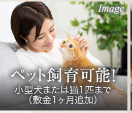
ペット飼育可能! 小型犬または猫1匹まで (敷金1ヶ月追加)