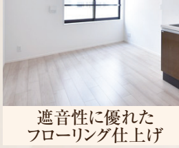
遮音性に優れた フローリング仕上げ