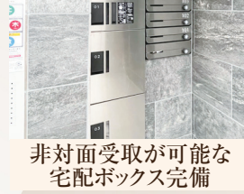
非対面受取が可能な 宅配ボックス完備