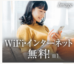
WiFi-インターネット 無料! ※1