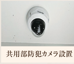
共用部防犯カメラ設置