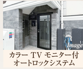
カラー TV モニター付 オートロックシステム