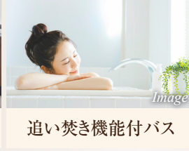
追い焚き機能付バス