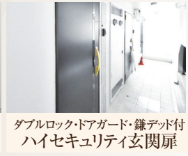
ダブルロック・ドアガード・鍵アッド付 ハイセキュリティ玄関扉