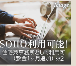
SOHO利用可能! 住宅兼事務所として利用可 (敷金1ヶ月追加) ※2