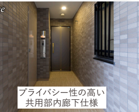
プライバシー性の高い 共用部内廊下仕様