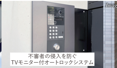
不審者の侵入を防ぐ TVモニター付オートロックシステム