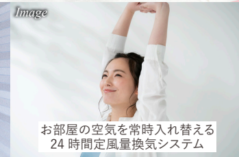
お部屋の空気を常時入れ替える 24時間定風量換気システム