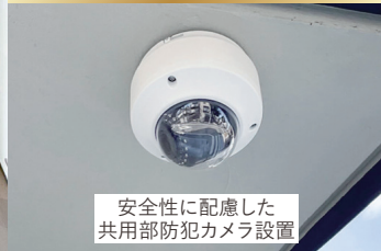
安全性に配慮した 共用部防犯カメラ設置