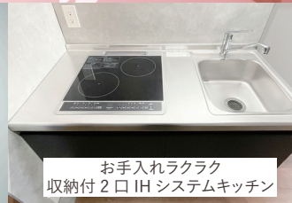
お手入れラクラク 収納付2口IHシステムキッチン