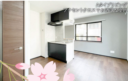
Aタイプリビング アクセントクロスでお洒落な室内

LDK 約8.7~9.7帖 + 1LDK 170,000円~ 洋室 約4.0~4.3帖