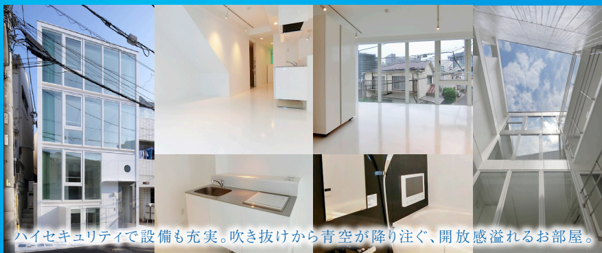
ハイセキュリティで設備も充実。吹き抜けから青空が降り注ぐ、開放感溢れるお部屋。