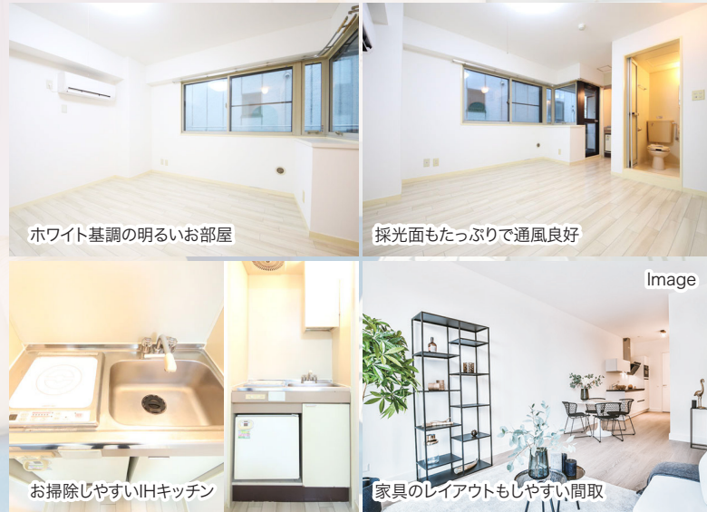
ホワイト基調の明るいお部屋