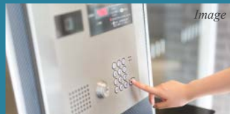
不審者の侵入を防ぐ TVモニター付オートロックシステム