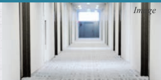
女性でも安心♪ 共用部内廊下仕様