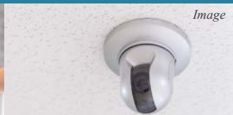
安全性に配慮した 共用部防犯カメラ