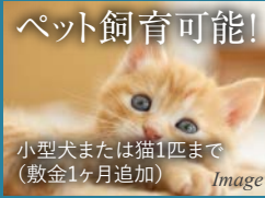
ペット飼育可能! 小型犬または猫1匹まで(敷金1ヶ月追加)