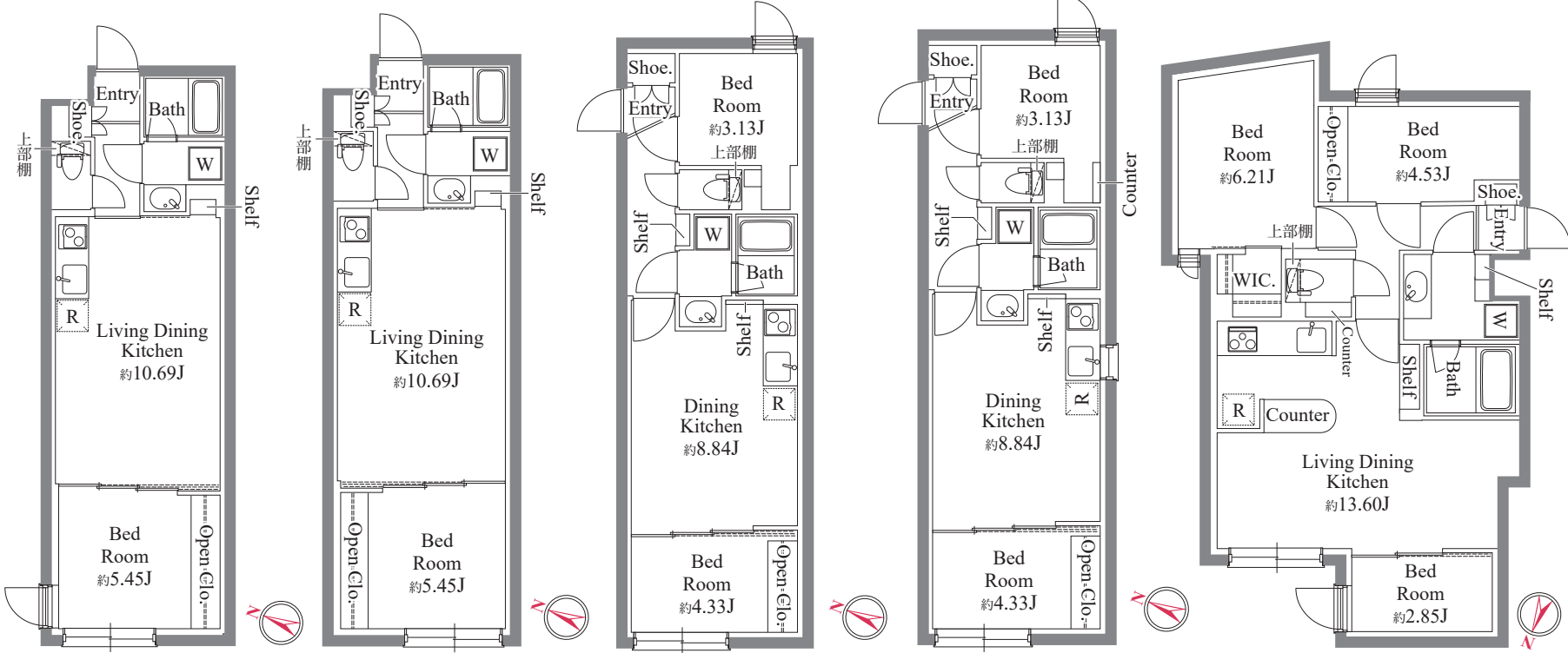
C1 1LDK 34.55㎡ C1はC1の反転タイプ