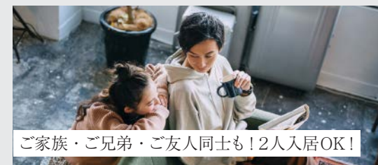
ご家族・ご兄弟・ご友人同士も！2人同居OK！

※図面と現況が異なる場合、現況優先とさせていただきます。 ○共益費：12,000円