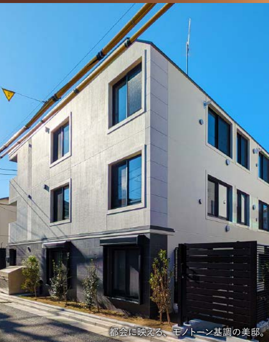
都会に映える、モノトーン基調の美邸。