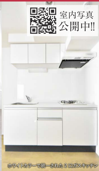
ホワイトカラーで統一された2口ガスキッチン