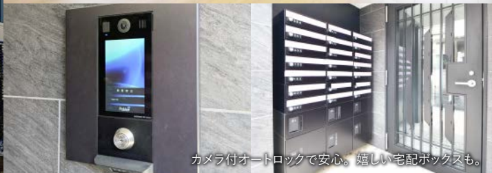
カメラ付オートロックで安心。嬉しい宅配ボックスも。