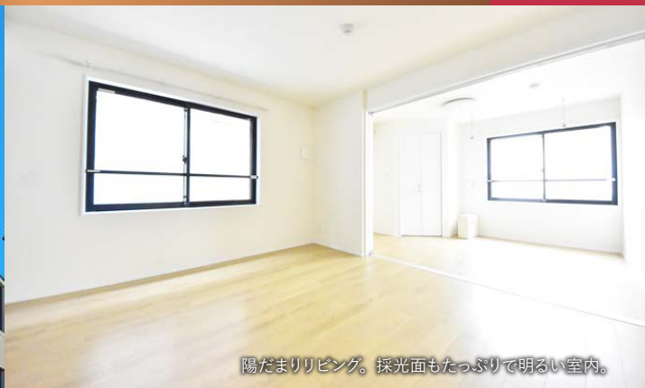
陽だまりリビング。採光面もたっぷり明るい室内。