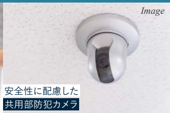
安全性に配慮した 共用部防犯カメラ