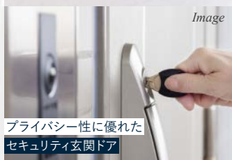
プライバシー性に優れた セキュリティ玄関ドア