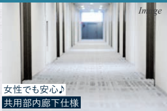
女性でも安心♪ 共用部内廊下仕様