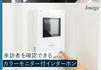
来訪者を確認できる カラーモニター付インターホン