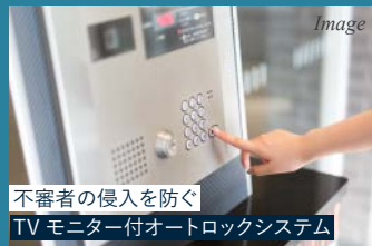
不審者の侵入を防ぐ TVモニター付オートロックシステム