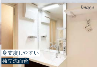
身支度しやすい 独立洗面台