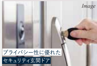
プライバシー性に優れた セキュリティ玄関ドア