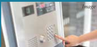
不審者の侵入を防ぐ TVモニター付オートロックシステム