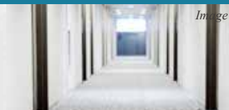
女性でも安心♪ 共用部内廊下仕様