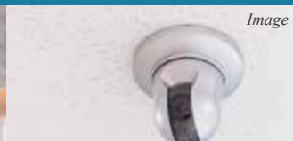
安全性に配慮した 共用部防犯カメラ