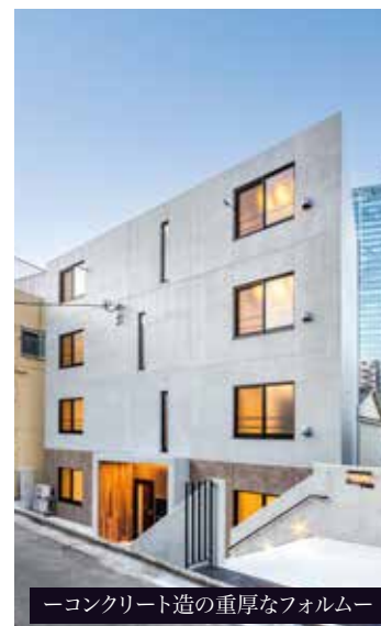
—コンクリート造の重厚なフォルム—