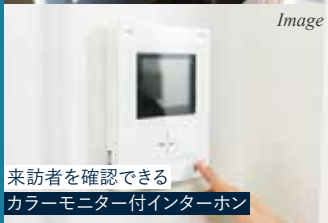
来訪者を確認できる カラーモニター付インターホン