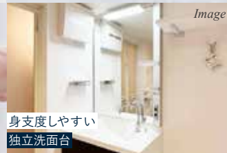
身支度しやすい 独立洗面台