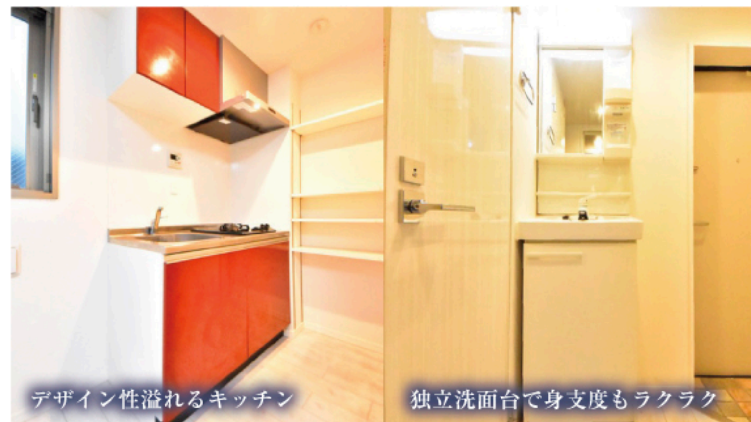
デザイン性溢れるキッチン