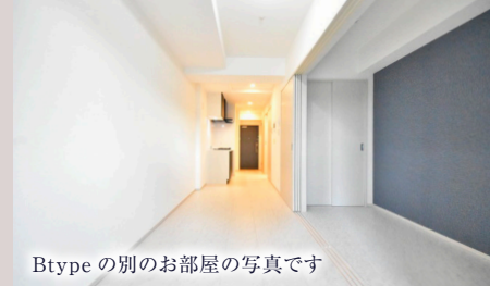
Btypeの別のお部屋の写真です