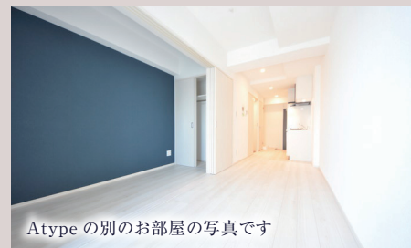
Atypeの別のお部屋の写真です