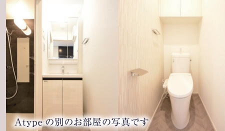
Atypeの別のお部屋の写真です

B 1LDK 26.98㎡ 402号室 118,000 円 6月13日入居可能予定