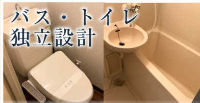
No.206 清潔で快適な水回り空間♪