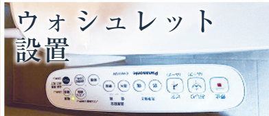
清潔な暖房便座付き 温水シャワートイレ