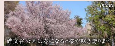
碑文谷公園は春になると桜が咲き誇ります。

目黒区の中でも碑文谷エリアは高級住宅街としても知られていますが、イオンスタイルやスーパー等の買い物環境もよく、広々とした公園もあり、ファミリーも住みやすい場所です。2駅3路線が利用可能で、目黒駅・渋谷駅まで乗り換え無しでアクセス可能なため、通勤・通学にも便利です。