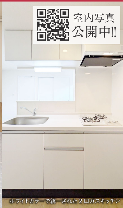
ホワイトカラーで統一された2ロガスキッチン