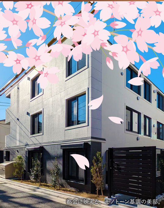
都会に映える、モノトーン基調の美邸。