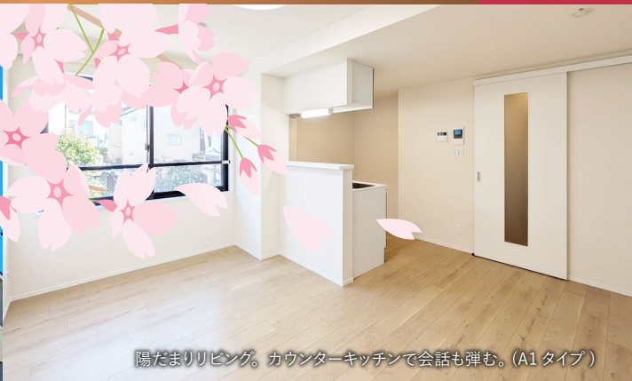
陽だまりリビング。カウンターキッチンで会話も弾む。(A1タイプ)