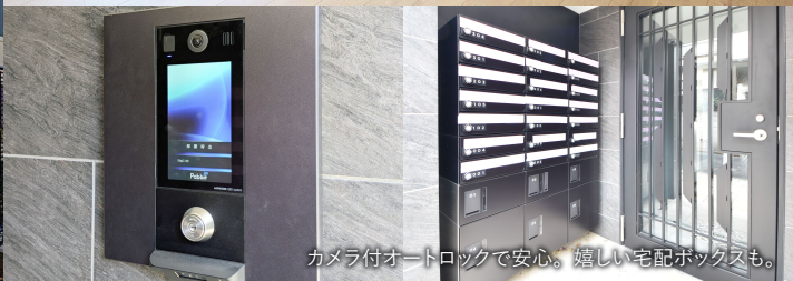
カメラ付オートロックで安心。嬉しい宅配ボックスも。