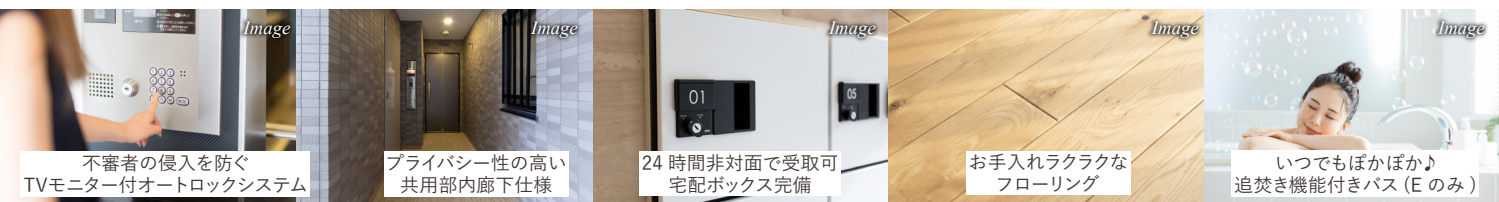
不審者の侵入を防ぐ TVモニター付オートロックシステム

住み心地を追求した安心安全な生活 - 1LDK 2LDK 184,000円~ 234,000円