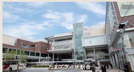
たまプラーザ駅舎

たまプラーザ駅周辺はファミリーが多く、公園も多く点在しています。たまプラーザ駅直結のショッピングモール「たまプラーザテラス」には、飲食店・生活雑貨店・スーパー等が入っており、お仕事帰りのお買い物にもとても便利です。駅舎も再開発により整備されており、街としても比較的治安が良く、落ち着いて暮らすことができます。自転車 8 分で國學院大學にもアクセスできます。