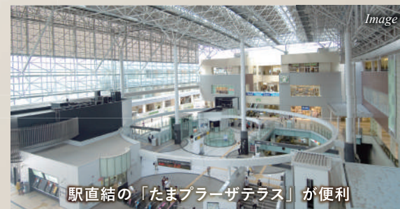
駅直結の「たまプラーザテラス」が便利