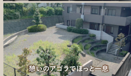
憩いのアゴラでほっと一息