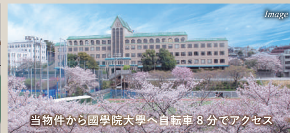
当物件から國學院大學へ自転車 8 分でアクセス

べじたフル王国さどや……………徒歩 3 分 横浜市立山内中学校……………徒歩 4 分 美しが丘第八公園……………徒歩 5 分 というきつたまプラーザ保育園……………徒歩 9 分 國學院大學……………自転車 8 分 東急百貨店たまプラーザ店……………徒歩 11 分 横浜市立山内小学校……………徒歩 17 分 ※自転車の所要時間は 250m/1 分換算です。