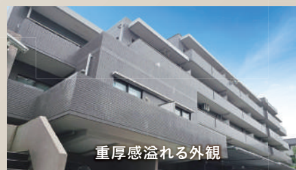
重厚感溢れる外観

べじたフル王国さどや……………徒歩 3 分 横浜市立山内中学校……………徒歩 4 分 美しが丘第八公園……………徒歩 5 分 というきつたまプラーザ保育園……………徒歩 9 分 國學院大學……………自転車 8 分 東急百貨店たまプラーザ店……………徒歩 11 分 横浜市立山内小学校……………徒歩 17 分 ※自転車の所要時間は 250m/1 分換算です。