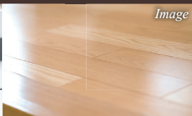
遮音性に優れた フローリング仕上げ