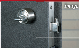
ダブルロック・ドアガード・鍵デッド付 ハイセキュリティ玄関扉