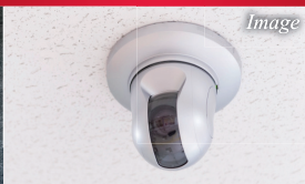
共用部防犯カメラ設置