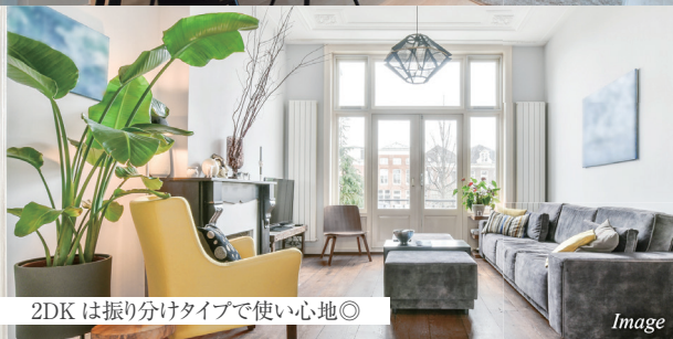
2DK は振り分けタイプで使い心地◎