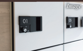
非対面受取が可能な 宅配ボックス完備