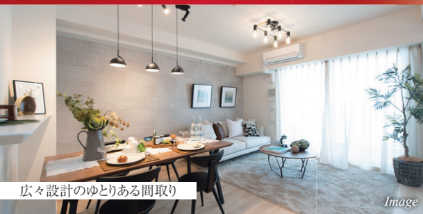
広々設計のゆとりある間取り