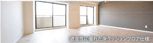
遮音性に優れた床クッションフロア仕様

109 号室 (64.98 m 2 ) 賃料 115,000 円 2026 年 2 月 20 日 入居可 (予定)