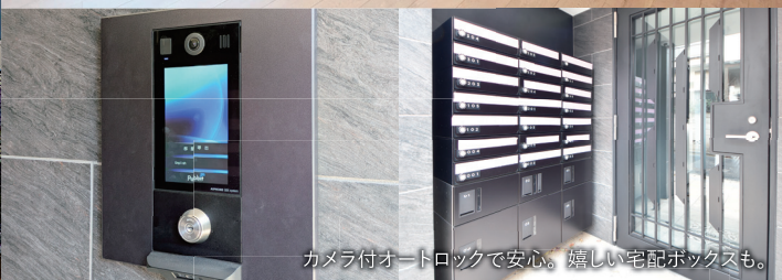
カメラ付オートロックで安心。嬉しい宅配ボックスも。