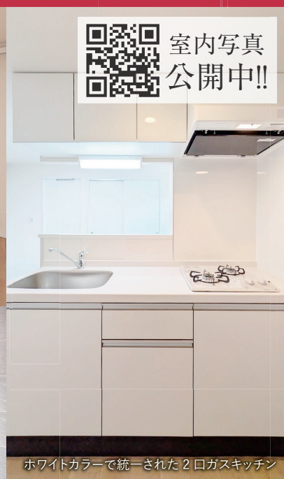
ホワイトカラーで統一された2口ガスキッチン