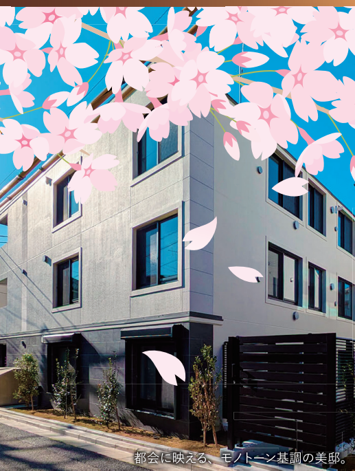
都会に映える、モノトーン基調の美邸。