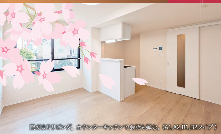
陽だまりリビング。カウンターキッチンで会話も弾む。(A1,A2,B1,B2タイプ)