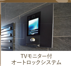
TVモニター付 オートロックシステム