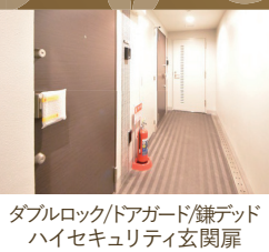
ダブルロック/ドアガード/鍵デッド ハイセキュリティ玄関扉