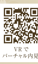
VRで バーチャル内見!