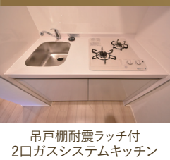
吊戸棚耐震ラッチ付 2口ガスシステムキッチン