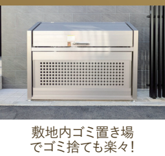
敷地内ゴミ置き場 でゴミ捨ても楽々!