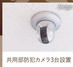
共用部防犯カメラ3台設置

東京メトロ銀座線 外苑前駅 徒歩10分 東京メトロ副都心線 北参道駅 徒歩10分 JR 山手線 原宿駅 徒歩14分