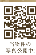
当物件の 写真公開中!