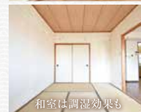
和室は調湿効果も