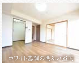
ホワイト基調の明るい室内