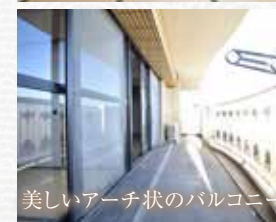
美しいアーチ状のバルコニー