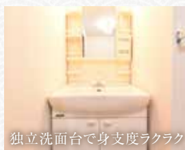
独立洗面台で身支度ラクラク