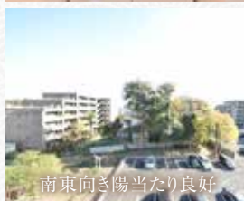
南東向き陽当たり良好