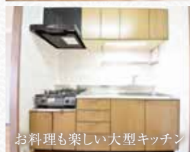
お料理も楽しい大型キッチン