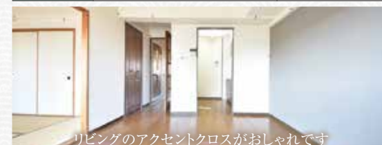
リビングのアクセントクロスがおしゃれです