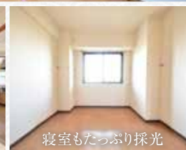
寝室もたっぷり採光