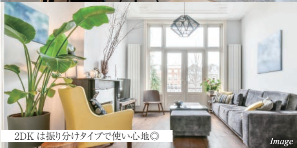
2DK は振り分けタイプで使い心地◎