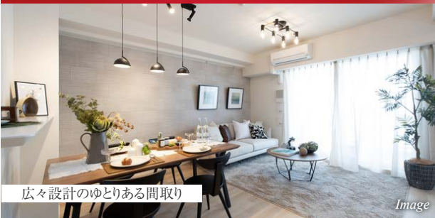
広々設計のゆとりある間取り