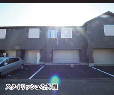
スタイリッシュな外観

この物件は更新時に無料で トイレ、バスルーム、エアコン、キッチン等 「プロのお掃除サービス」が付いています!