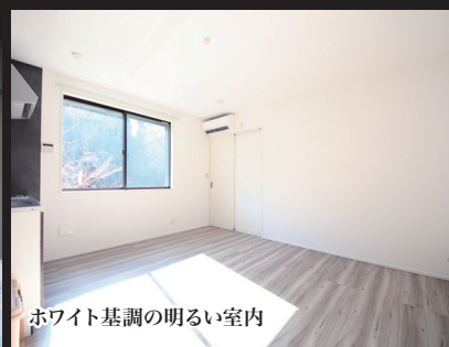
ホワイト基調の明るい室内