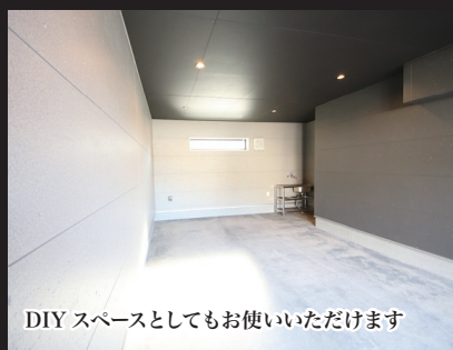
DIY スペースとしてもお使いいただけます