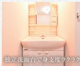
独立洗面台で身支度ラクラク