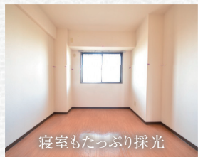
寝室もたっぷり採光