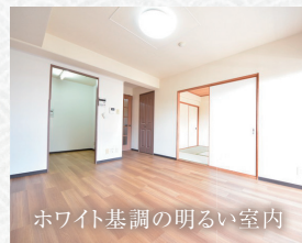
ホワイト基調の明るい室内