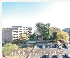
南東向き陽当たり良好