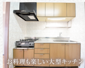
お料理も楽しい大型キッチン