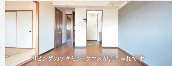
リビングのアクセントクロスがおしゃれです