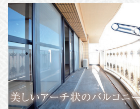
美しいアーチ状のバルコニー