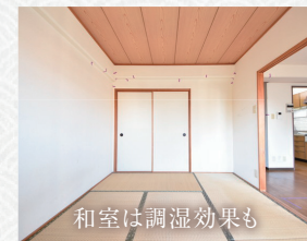
和室は調湿効果も