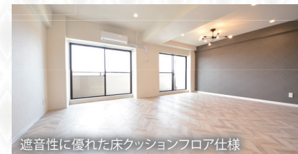
遮音性に優れた床クッションフロア仕様