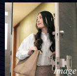
堅牢なセキュリティー 玄関ドア