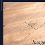
インテリアに合う フローリング仕上げ