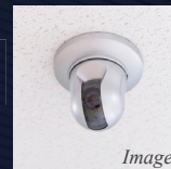
防犯カメラ 3台設置