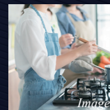
お料理を楽しく 3口ガスコンロ