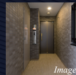
内廊下仕様の 共用部