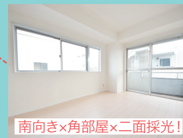
南向き×角部屋×二面採光!