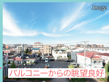
バルコニーからの眺望良好