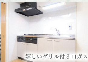
嬉しいグリル付3口ガス