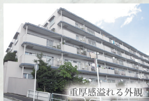
重厚感溢れる外観