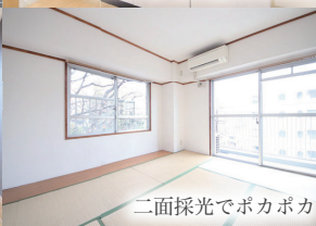
二面採光でポカポカ