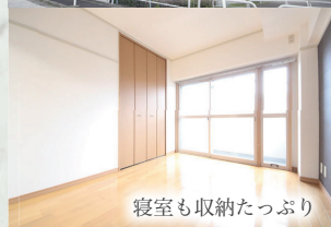
寝室も収納たっぷり