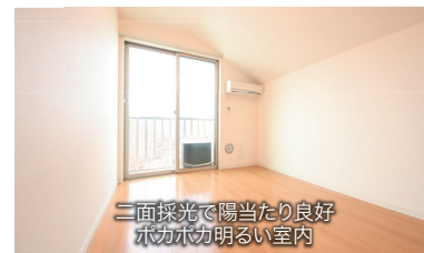
二面採光で陽当たり良好 ホカホカ明るい室内