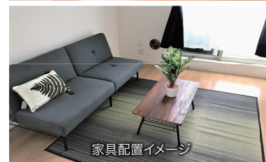
家具配置イメージ