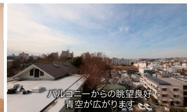
バルコニーからの眺望良好 青空が広がります