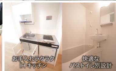
お手入れラクラク IHキッチン