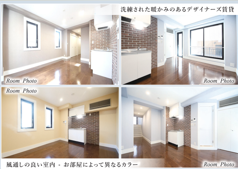
洗練された暖かみのあるデザイナーズ賃貸