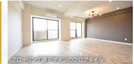
フローリング調デザインのフロアタイル