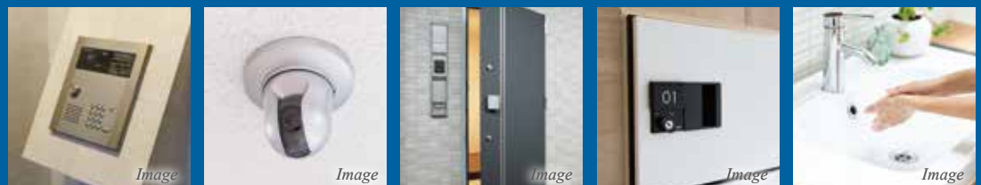
TVモニター付オートロックシステム 共用部に防犯カメラ設置 ダブルロック等堅牢な玄関扉 不在時の荷物の受取も便利宅配ボックス設置 朝の身支度もラクラク独立洗面台設置

1フロア2~3住戸の贅沢設計 Studio 20.12㎡ 74,000 円~ 広々ウォークインも完備。