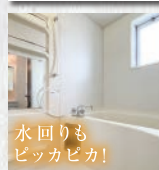
水回りも ピッカピカ!