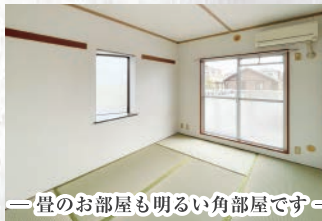
—畳のお部屋も明るい角部屋です—