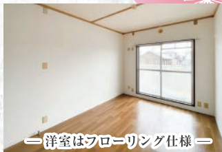
—洋室はフローリング仕様—