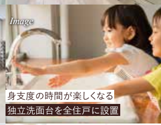
身支度の時間が楽しくなる 独立洗面台を全住戸に設置