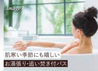
肌寒い季節にも嬉しい お湯張り・追い焚き付バス