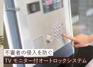
不審者の侵入を防ぐ TVモニター付オートロックシステム