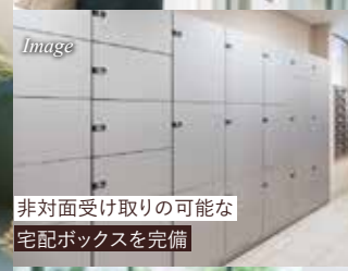
非対面受け取りの可能な 宅配ボックスを完備