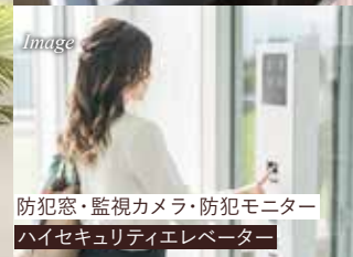
防犯窓・監視カメラ・防犯モニター ハイセキュリティエレベーター