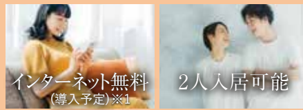
インターネット無料 (導入予定)※1