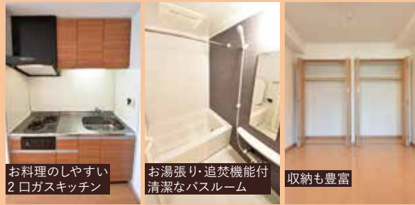
お料理のしやすい 2口ガスキッチン