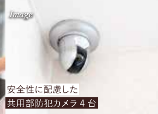
安全性に配慮した 共用部防犯カメラ4台