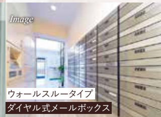
ウォールスルータイプ ダイヤル式メールボックス