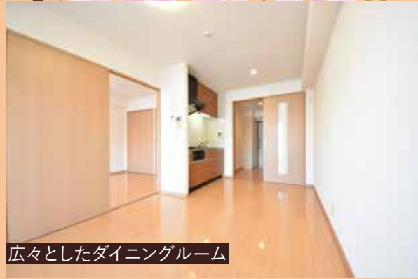
広々としたダイニングルーム

※図面と現況が異なる場合、現況優先とさせていただきます。 ※D'タイプは反転タイプとなります。