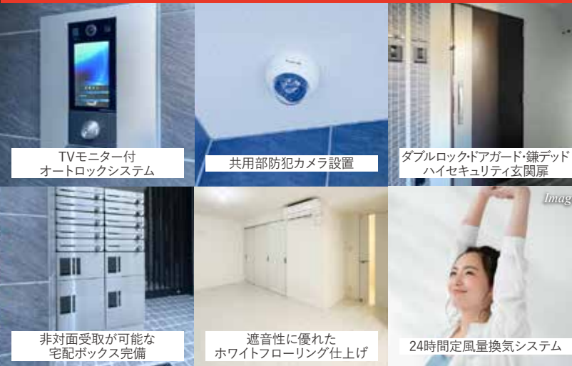
TVモニター付 オートロックシステム

1LDK×ワンフロア2世帯のプライベート空間 220,000円~255,000円