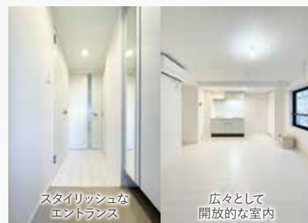
スタイリッシュなエントランス 広々として開放的な室内