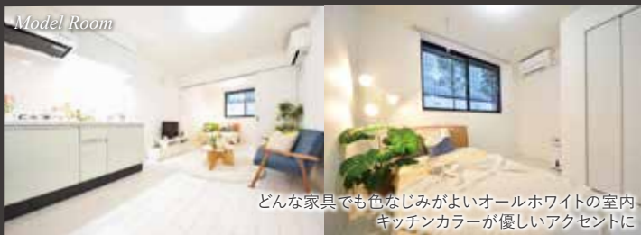
どんな家具でも色なじみがよいオールホワイトの室内 キッチンカラーが優しいアクセントに