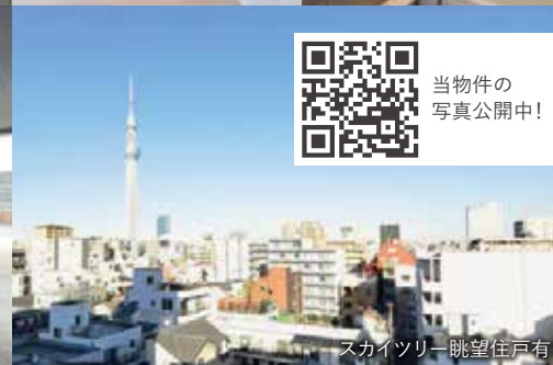
スカイツリー眺望住戸有り