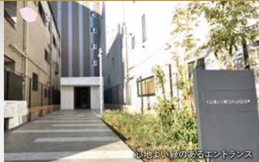
心地よい緑のあるエントランス