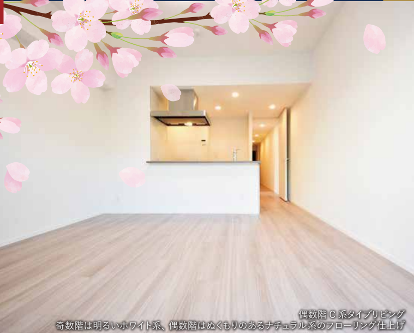
偶数階 C系タイプリビング 奇数階は明るいホワイト系、偶数階はぬくもりのあるナチュラル系のフローリング仕上げ