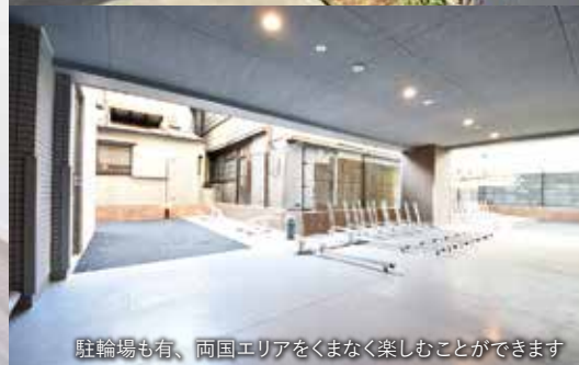
駐輪場も有、両国エリアをくまなく楽しむことができます