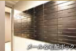
メール&宅配ボックス