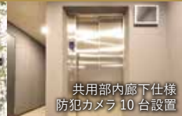
共用部内廊下仕様 防犯カメラ 10 台設置