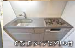
C系,Dタイプはグリル付