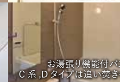
お湯張り機能付バス C系,Dタイプは追い焚きも