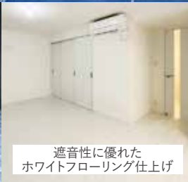
遮音性に優れた ホワイトフローリング仕上げ