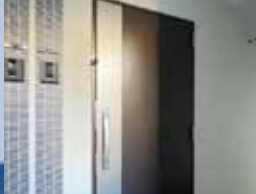
ダブルロックドアガード・鍵デッド ハイセキュリティ玄関扉