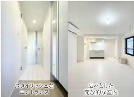
※図面と現況が異なる場合、現況優先とさせていただきます。 ※001,002 住戸は地平面より下っております。