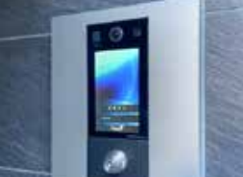
TVモニター付 オートロックシステム