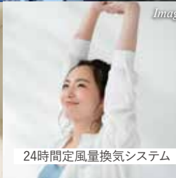
24時間定風量換気システム