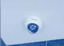
共用部防犯カメラ設置