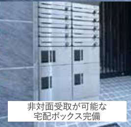
非対面受取が可能な 宅配ボックス完備