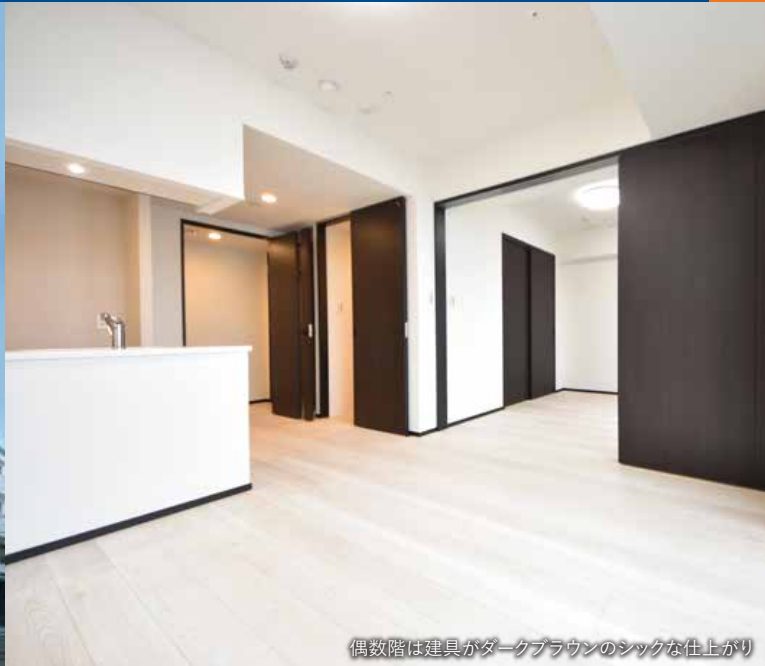
偶数階は建具がダークブラウンのシックな仕上がり