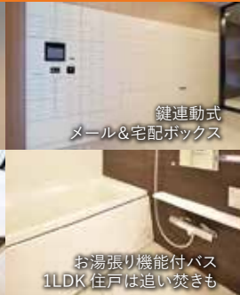
お湯張り機能付バス 1LDK 住戸は追い焚きも