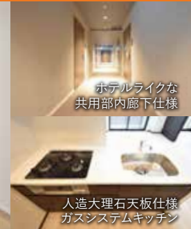
人造大理石天板仕様 ガスシステムキッチン