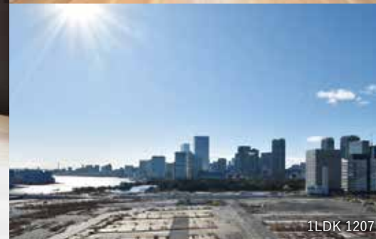
1LDK 1207号室より撮影 ※景色は永続的に保証できるものではありません