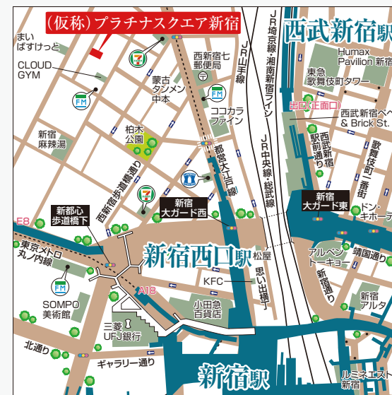
※図面と現況が異なる場合、現況優先とさせていただきます。 ○共益費：12,000円