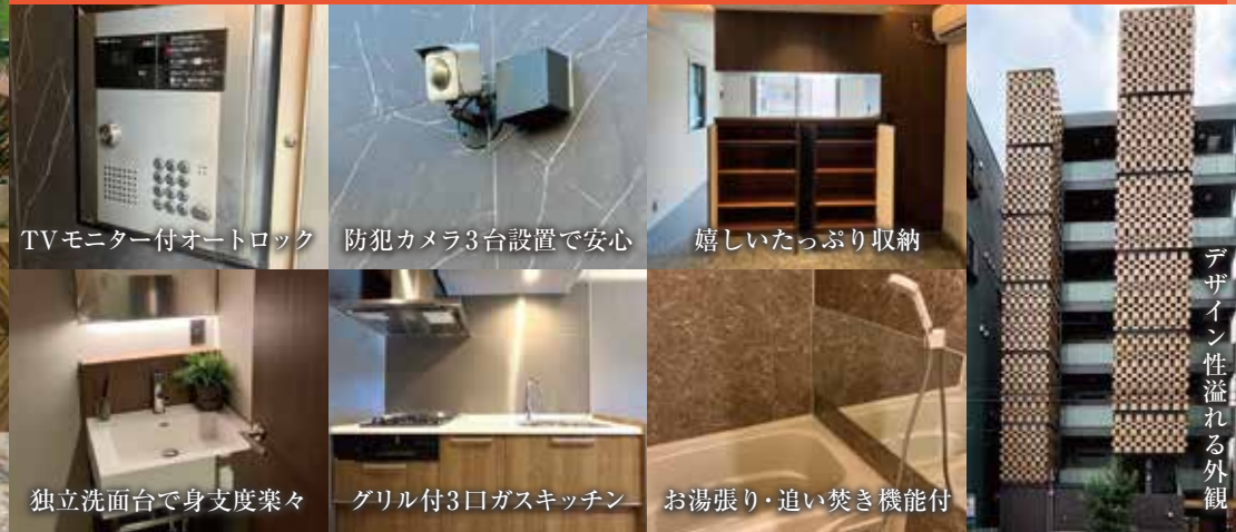
TVモニター付オートロック