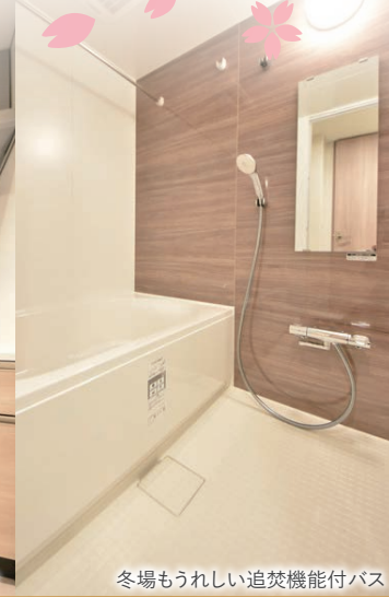
冬場うれしい追焚機能付バス