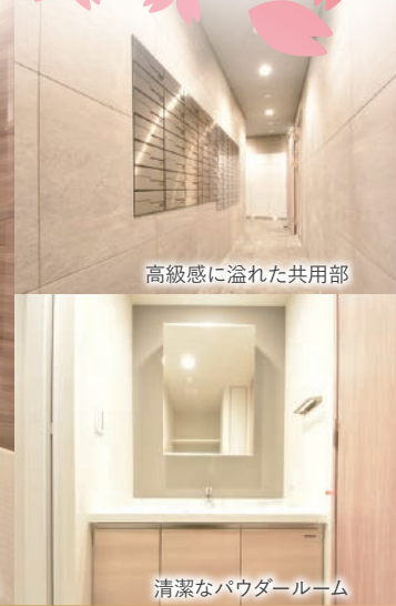
高級感に溢れた共用部