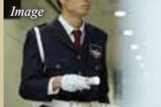
24時間有人管理による マンションセキュリティ