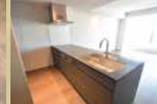
食洗器・ディスポーザー付 3口IHシステムキッチン