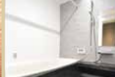
お湯張り 追い焚き機能付バス