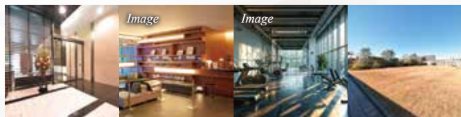
エントランス パーティールーム フィットネスルーム スカイガーデン