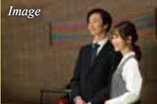
ラ・トゥール飯田橋専属 コンシェルジュサービス