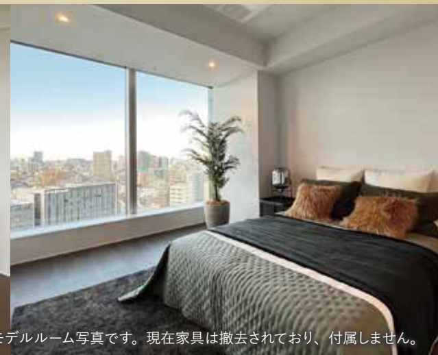
当物件のモデルルーム写真です。現在家具は撤去されており、付属しません。