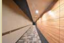
プライバシー性の優れた 内廊下設計