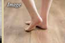
足下から暖かい リビング床暖房完備