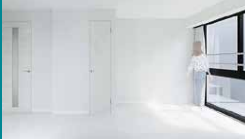
人気の白系フローリング 家具家電のカラーリングも自由自在