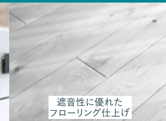
遮音性に優れた フローリング仕上げ