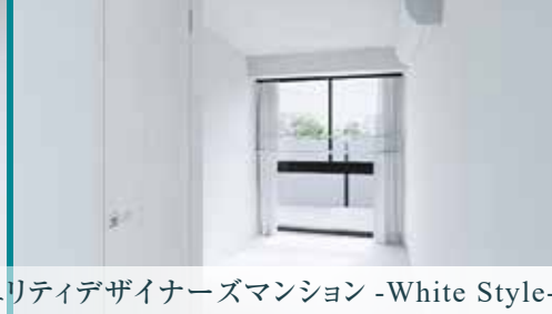
ハイセキュリティデザイナーズマンション -White Style-