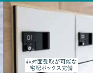
非対面受取が可能な 宅配ボックス完備