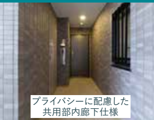
プライバシーに配慮した 共用部内廊下仕様