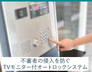
不審者の侵入を防ぐ TVモニター付オートロックシステム